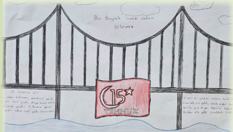
Zeynep Duru KUŞ

15 Temmuz, milletimizin demokrasiye ve özgürlüğe olan inancının bir göstergesidir.