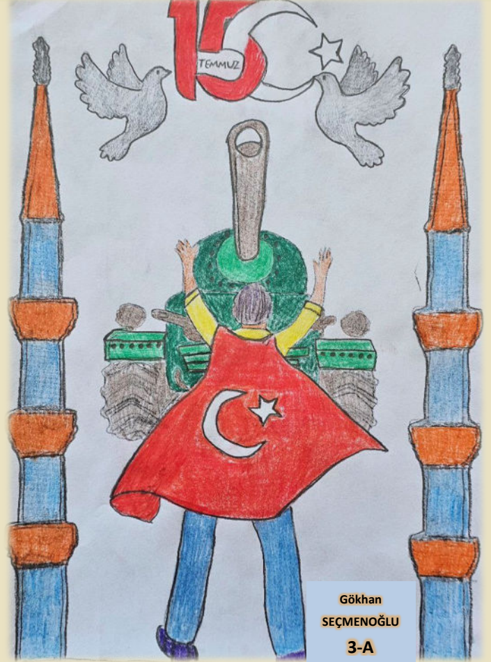
Gökhan SEÇMENOĞLU 3-A

FETÖ kısaltması, halkın dini duygularını sapkın görüşleriyle istismar eden Fetullahçı Terör Örgütünü ifade eder. Sınav sorularını çalarak devlet kurumlarına haksız şekilde yerleşen; eğitim, adalet ve güvenlik alanları başta olmak üzere, kamu imkanlarını kendi çıkar ve amaçları için kullanan bir terör örgütüdür.