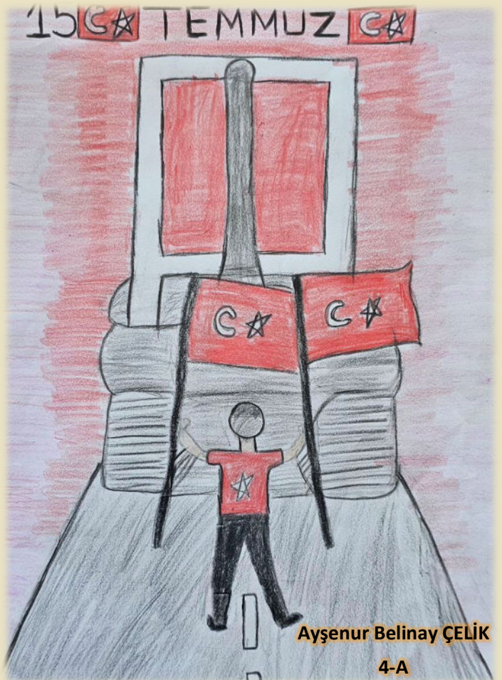
Ayşenur Belinay ÇELİK